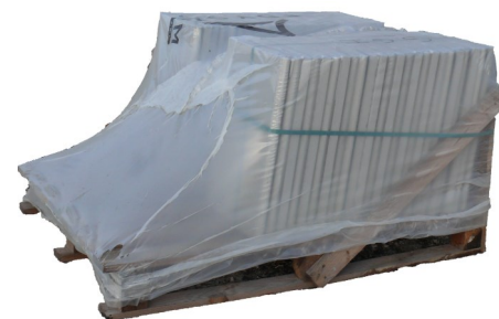
Palette margelles droites ardoisées - Ton Pierre