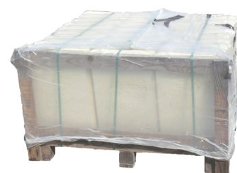
Palette margelles piscine - Droites