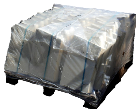
Palette margelles piscine - Courbe