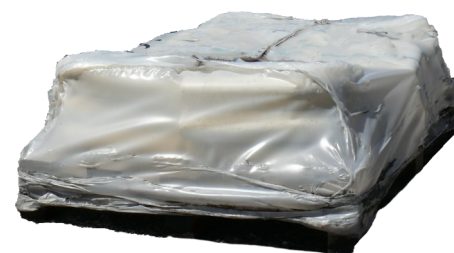
Palette de margelles piscine - Angle sortant