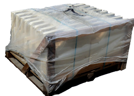
Palette margelles piscine - Angle rentrant