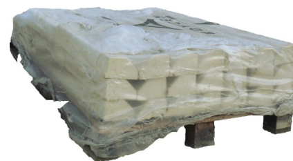
Palette bordures sablées ton pierre

Pratique : 2 sens de pose pour plus de hauteur de rive