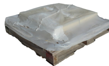
Palette de chapeaux de pilier CASA