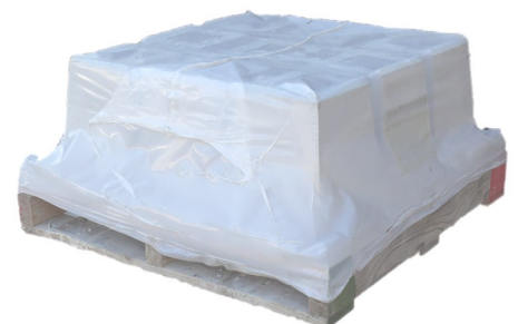
Palette dés en béton grand modèle - ton pierre

** Découper la housse de façon à pouvoir la refermer par le dessus, si besoin.