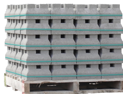
Palette de plots béton pour terrasses