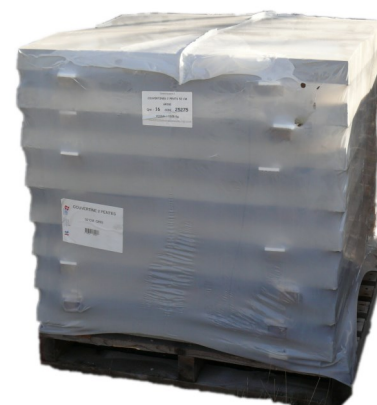
Palette couvertines 2 pentes - Largeur 52 cm