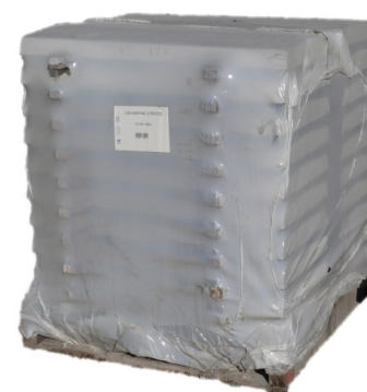
Palettes couvertines 2 pentes - Largeur 42 cm