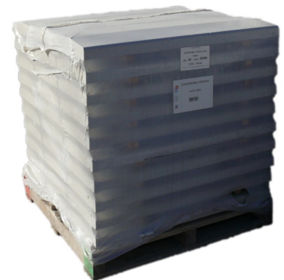
Palette couvertines moulées 2 pentes - Largeur 33 cm