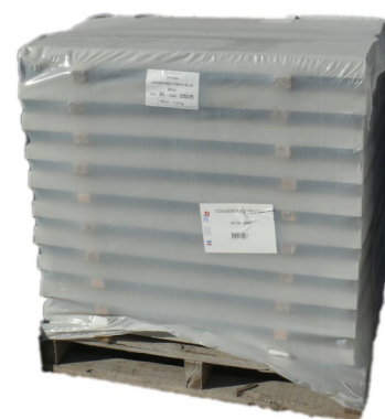
Palette couvertines moulées 2 pentes - Largeur 28 cm