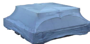
Palette de chapeaux de pilier CASA